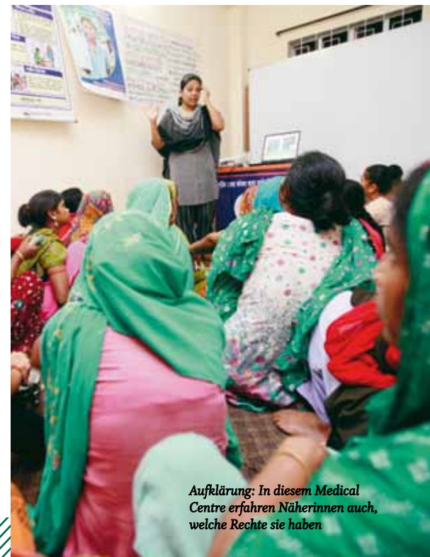
Aufklärung: In diesem Medical Centre erfahren Näherinnen auch, welche Rechte sie haben