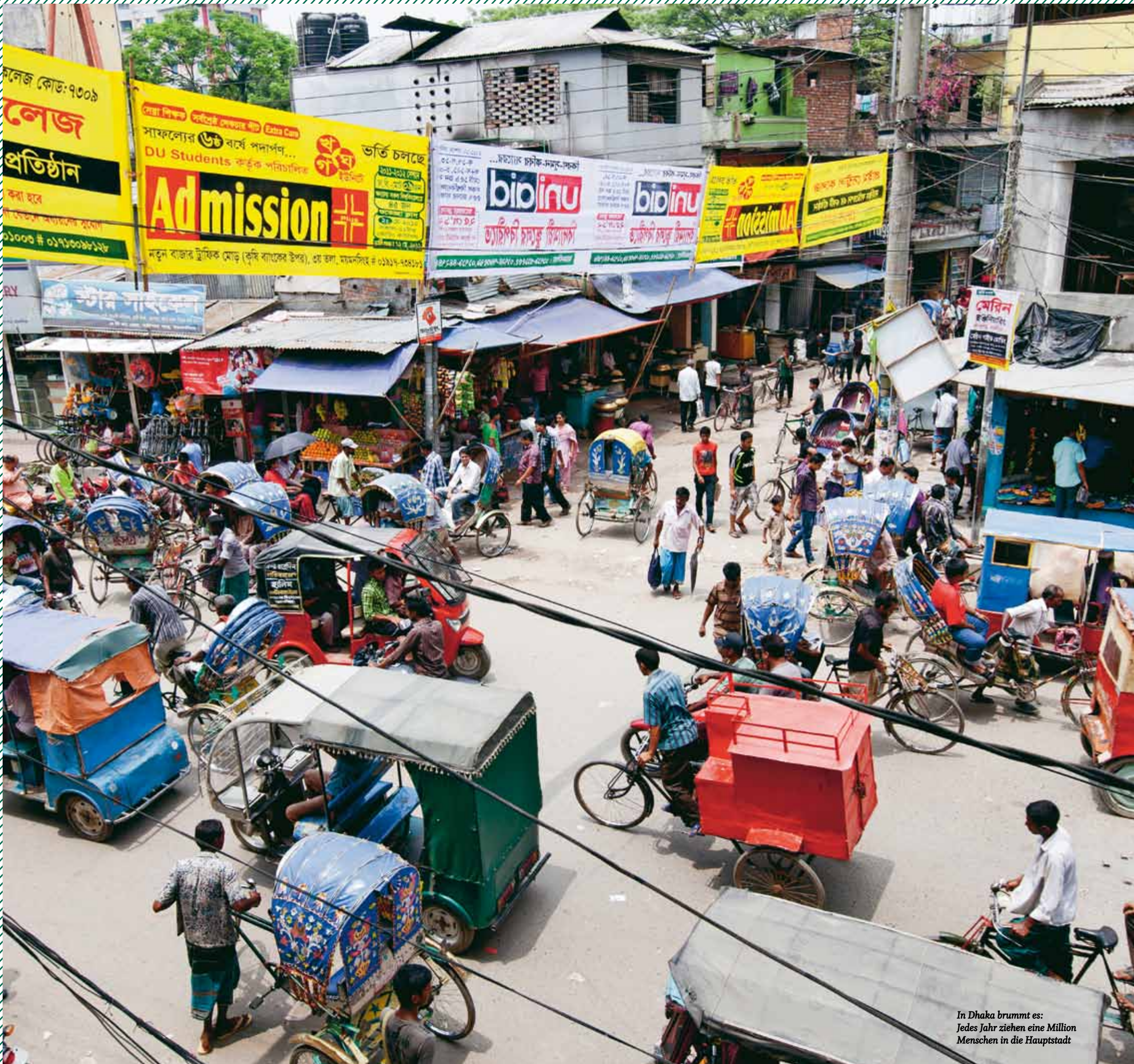
In Dhaka brummt es: Jedes Jahr ziehen eine Million Menschen in die Hauptstadt

Seit dem Brand geht Akter alle paar Tage auf die Straße, organisiert Demonstrationen und versucht, Druck auf alle Beteilig-