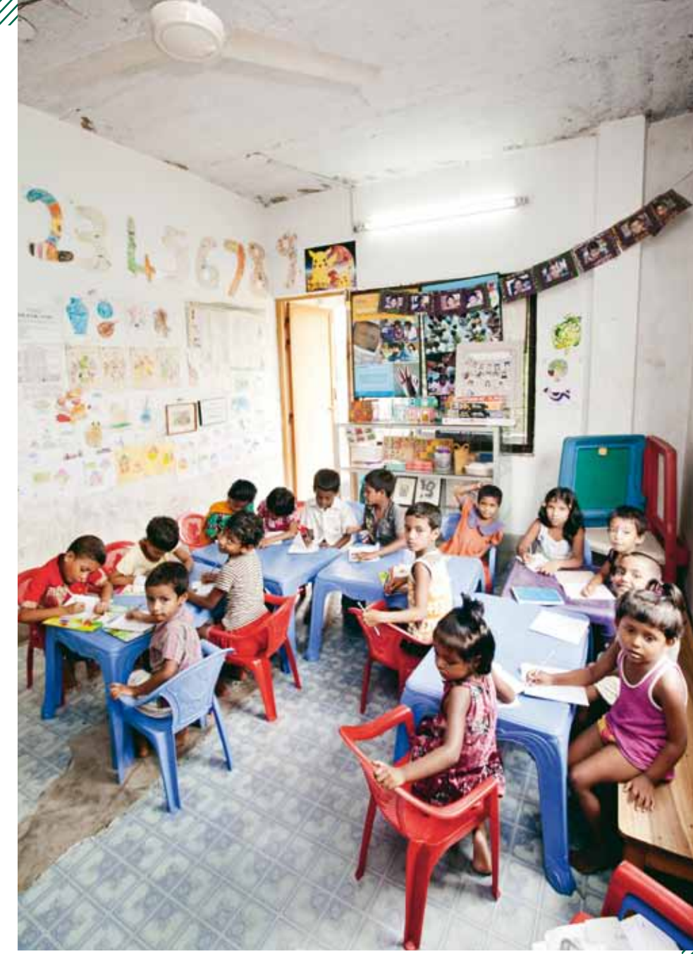
...während ihre Kinder in der Produktionsstätte von Hathay Bunano zur Vorschule gehen

Die 50-Jährige ist Geschäftsführerin des CSR Centre, eine ernste, stolze Frau, die ihre analytischen Antworten knapp formuliert. Sie wuchs in London und Boston