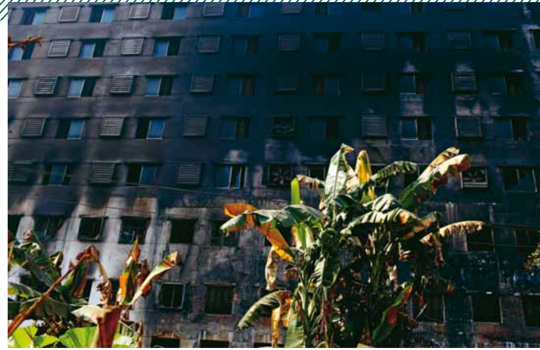
Tazreen Fashion: In dieser Fabrik in Dhaka starben im November bei einem Brand 112 Arbeiter