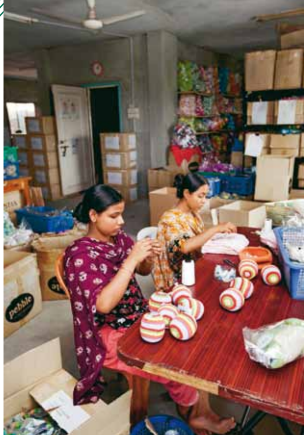
Arbeiterinnen stellen Spielzeug und Babykleidung her...

Zu Beginn der 1970er standen die Chancen des neuen Staates nicht sehr gut. Nach dem Krieg waren es Hungersnöte, Flutkatastrophen und Militärputsche, die die Lage zusätzlich destabilisierten. In diesen Jahren gründete sich BRAC, eine NGO, die Flüchtlingen bei ihrer Rückkehr half, Häuser aufbaute oder Boote von Fischern instand setzte. Aus der kurzfristigen Wiederaufbauarbeit wurde ein langfristiges Engagement. Inzwischen ist BRAC in elf